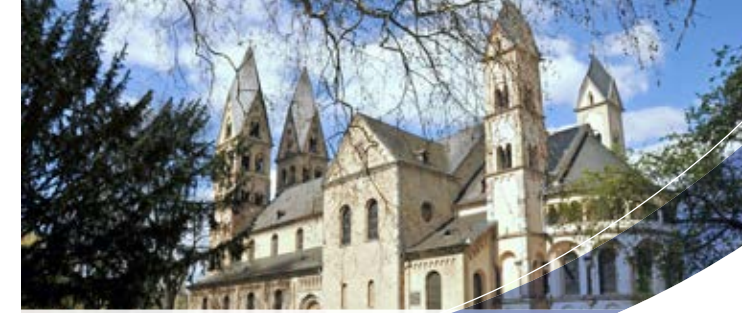
St. Kastor, Koblenz' älteste Kirche aus dem 9. Jahrhundert

Der Bachelorstudiengang qualifiziert für Tätigkeitsfelder in Schule, Medien, Bibliothekswesen, Verlagen, Stiftungen, Politik und Kirche. Zusätzlich qualifiziert der Masterstudiengang die Absolventen für Aufgabenbereiche in der Wissenschaft.